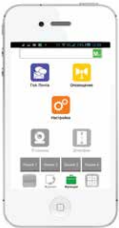
Экран доступа к функциям настройки приложения, голосовой почты, оповещения, трансляций IP камер, приложения M54