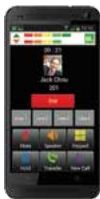
M54 для Android