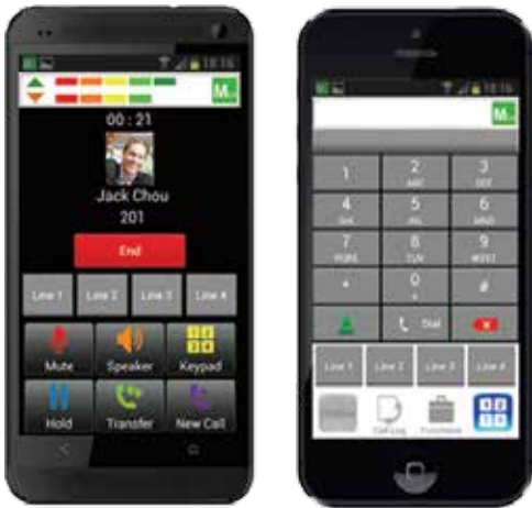
M54 для Android