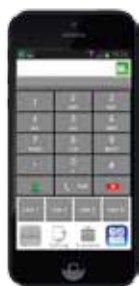
M54 для iPhone